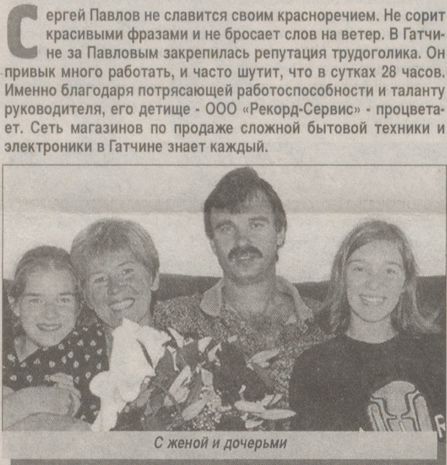
С женой и дочерьми